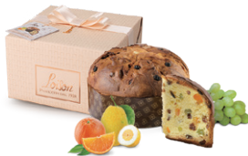
パネトーネ クラシコ 500g

伝統的なイタリアのお菓子、パネトーネ。ロイゾン社の厳選素材とこだわり製法で深い味わいの人気商品です。 クリスマスプレゼントにも最適なパッケージもお楽しみください。