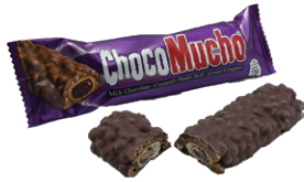
チョコムーチョ ミルク

1963年創業。フィリピン国内菓子シェアNo.1の会社の人気商品です。 ウエハース、シリアルパフ、キャラメル、チョコフレーバーコーティングの4つの食感の違いをお楽しみください。