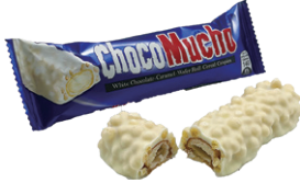
チョコムーチョ ホワイト

J A N | 4800092660962 単箱JAN | 4800092660979