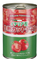
NORLAKE 完熟カットトマト