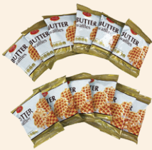
ワッフル バター風味

規 格 | 180g x 24入 賞味期限 | 12ヶ月 原 産 国 | ベトナム J A N | 8938506170793