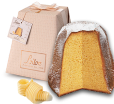
パネドーロ クラシコ 1kg

規 格 | 1kg x 6入 賞味期限 | 8ヶ月 原 産 国 | イタリア UPCCODE | 799729001183