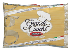
granoro グラノーロ スパゲティ No.14(1.6mm)