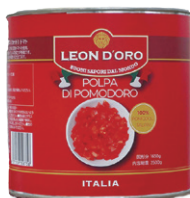
LEON DORO レオンドーロ カットトマト