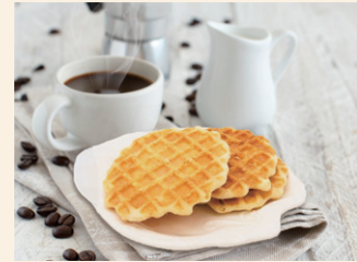
朝食やおやつ、お茶請けに

伝統的なイタリアのお菓子、パネトーネ。ロイゾン社の厳選素材とこだわり製法で深い味わいの人気商品です。 クリスマスプレゼントにも最適なパッケージもお楽しみください。