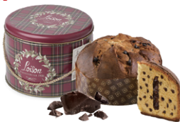
パネトーネ リーガルチョコレート 特製缶入 750g

規 格 | 750g x 6入 賞味期限 | 8ヶ月 原 産 国 | イタリア UPCCODE | 799729011557