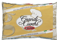
granoro グラノーロ スパゲティ No.13(1.78mm)