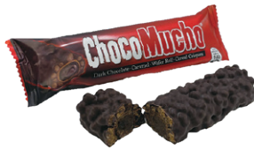
チョコムーチョ ダーク

J A N | 4800092660634 単箱JAN | 4800092660641