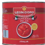
LEON DORO レオンドーロ ホールトマト

100%イタリア産(プーリア州)の完熟トマト ダイス状にカットで調理時間の短縮が可能