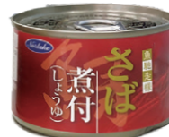
NORLAKE さば煮付(しょうゆ)150g