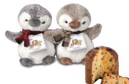
パネットンチーノ クラシコ ミニオン マスコット 100g

規 格 | 100g x 8入 賞味期限 | 8ヶ月 原 産 国 | イタリア UPCCODE | 799729009288