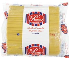
Riesco ルッコ スパゲティ テフロン(1.7mm)