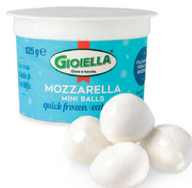
モzzarella・ヴァッカ ミニボール125g