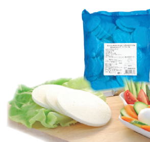
モzzarella・ヴァッカ IQF スライスタイプ25g