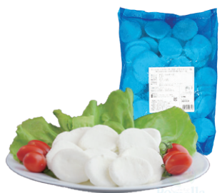
モzzarella・ヴァッカ IQF メダルタイプ 18g