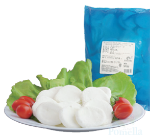
モzzarella・ヴァッカ IQF メダルタイプ 10g