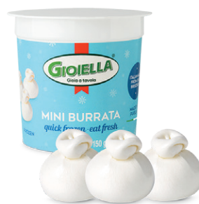
モzzarella・ヴァッカ ミニブルラータ150g