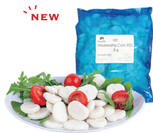
モzzarella・ヴァッカ IQF コインタイプ 5g

1929年創業のイタリア・ラツィオ州にあるチーズ製造メーカー、ユーロポメラ社。 フレッシュチーズとIQFチーズの製造販売に力を入れ、80年以上にわたって高品質のチーズを提供しています。