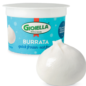
モzzarella・ヴァッカ ブルラータ100g

Gioia a tavola(食卓の喜び)をテーマに掲げるジョイエッラ。 プーリア州Gioia del colleで2人の兄弟によって1942年に創業しました。