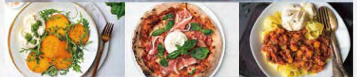
サラダ・ピザ・パスタ等