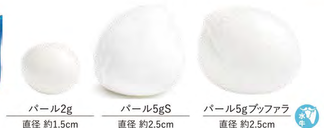
パール2g 直径 約1.5cm

小粒で扱いやすい球状タイプ。量の調整がしやすくサラダに立体感を出すほか、生食や詰め物にもおすすめです。